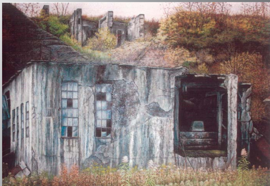
58回三軌展 佳作賞作品(2006年) 北炭清水沢発電所

かつて日本の近代化を支え、栄華を誇った炭鉱街… その機能を失ったときから、 まるで忘れ去られて「夢の跡」となった産業施設たら… 雑木林、草原に残されたレンガ造りのその施設は、 私たちに何を語っているのだろう。 ひとつひとつ積み重ねられたレンガ、崩落するコンクリートの 壁面の細密な描写、木々の表情、 「実際」以上と思われる静寂とリアリティーな世界が、 キャンバスに広がる。